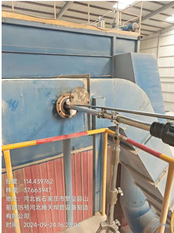
DA003 除尘器及排气筒采样口