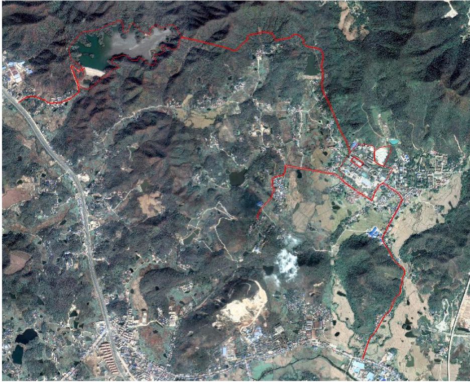
项目区卫星遥感影像图（2015年4月）